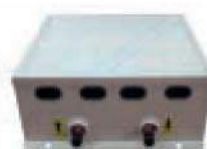
AHUKZ-01A AHUKZ-01B AHUKZ-02A AHUKZ-02B AHUKZ-03A AHUKZ-03B